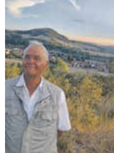
Geismar, im März 2026