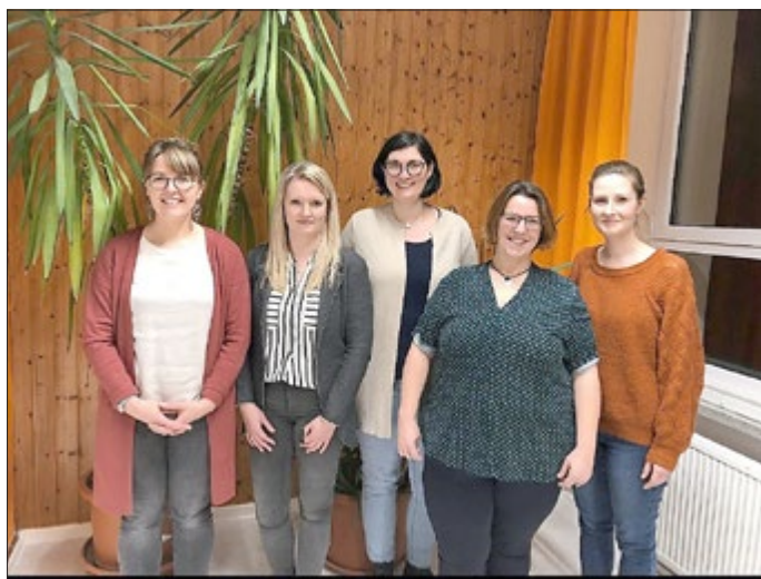
Ein Team von engagierten Mitstreitern für das Wohl der Schule und der Schüler.