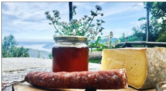
„Genuss“ - Regionalität auf dem Teller, Regionale Wirtschaftskreisläufe stärken, das ist Aufgabe der Partnerinitiative

Partnerbetriebe werden nach bundesweit einheitlichen Qualitäts- und Umweltstandards ausgezeichnet und engagieren sich für Umwelt und Natur. In 30 Initiativen bieten Ihnen über 1.400 Partner nachhaltige Angebote für Übernachtungen, Gastronomie, Handwerk, Naturerlebnisse und vieles mehr. http://partner.nationale-naturlandschaften.de/