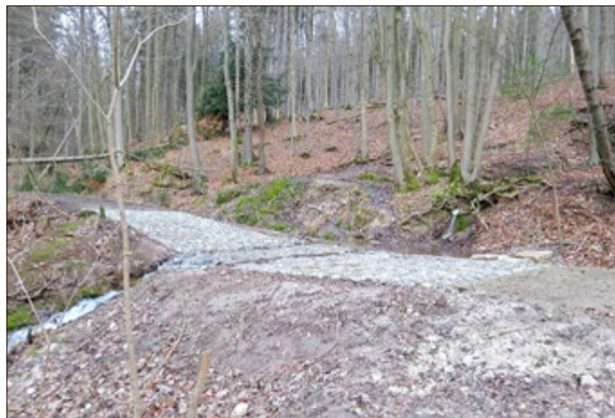
Die Kalktuffquelle bei Bernterode. Vor allem die entstandenen Flachwasserbereiche dienen den Larven des Feuersalamanders als Lebensraum.