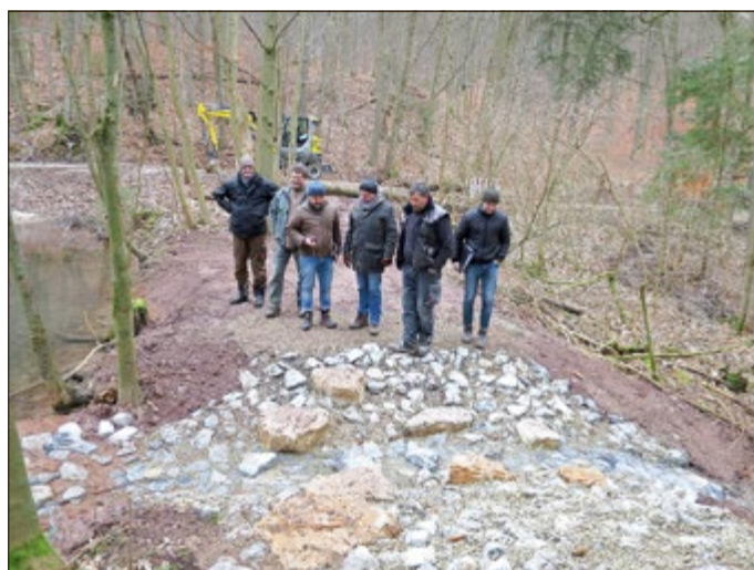
Eigentümer, Revierleiter, Ingenieure und Vertreter der Baufirma begutachten die fertiggestellte Überlaufscharte.