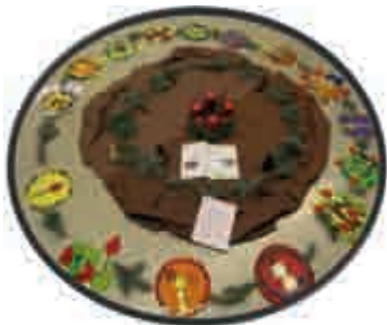
Adventskranz - Legebild der Vorschulgruppe

Alle Lichter, die wir anzünden, zeugen von dem Licht, das da erschienen ist in der Dunkelheit. Friedrich von Bodelschwingh