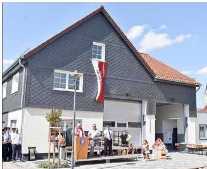
Das neue Mehrzweckgebäude ist eine Zierde im Dorfzentrum von Geismar