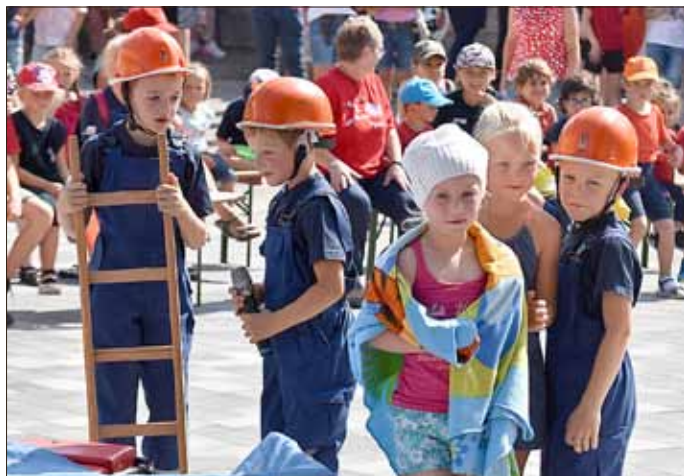
Mit einem Theaterstück und einer „Einsatzübung“ begeisterte der Kindergarten