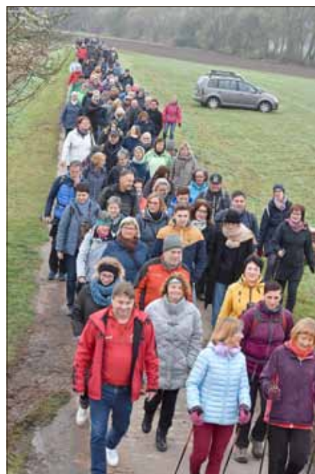
In einem Sternmarsch ziehen die Südeichsfelder und Treffurter nach Großburschla.