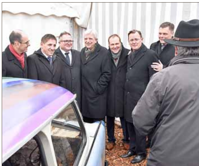
Die fünf Bürgermeister aus Thüringen und Hessen mit den Ministerpräsidenten beider Länder zum Erinnerungsbild an einem Trabi.