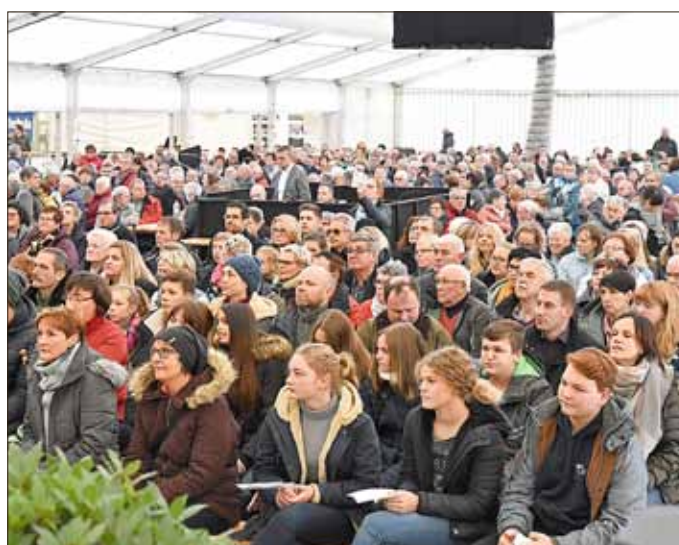
Bis auf den letzten Platz war das Zelt beim ökumenischen Festgottesdienst gefüllt.