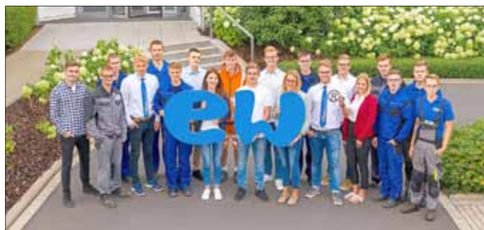
Sie alle wissen genau, wo sie hingehören - denn sie haben ihren festen Platz in der heimischen Arbeitswelt gefunden.

Wer die vielfältigen Perspektiven bei den Eichsfeldwerken kennenlernen möchte, wendet sich gern an das Team der Personalabteilung: 03606/655-139. Online gibt es Infos unter www.eichsfeldwerke.de/unternehmensgruppe/karriere/ .