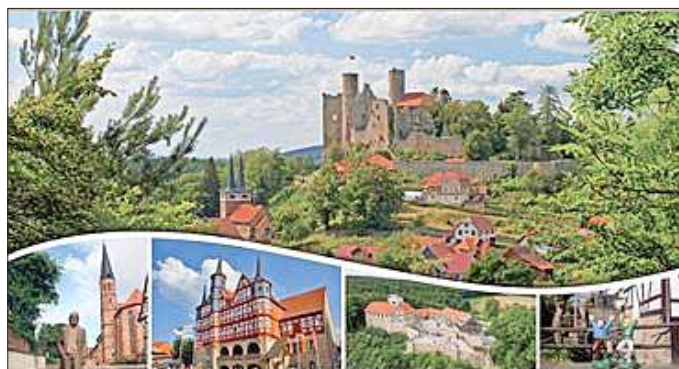
Neue Postkartenmotive vom Eichsfeld