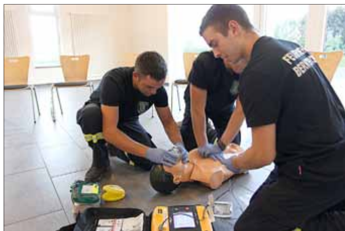
Trainiert wurde der Einsatz des AEDs bei einer Reanimation im Zusammenspiel mit Beatmung und Herzdruckmassage