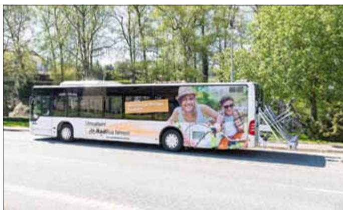
Jedes Fahrrad kann Bus fahren.

Auch größere Fahrradgruppen werden gern mitgenommen. Dafür stehen spezielle Anhänger für bis zu 16 Räder bereit. Hierfür ist 24 Stundenvorher eine Anmeldung bei der Mobilitätszentrale unter 03605 5152-53 notwendig.