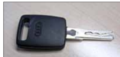
Autoschlüssel (PKW Audi)

wurde im Fundbüro der Verwaltungsgemeinschaft „Ershausen/Geismar“ abgegeben: