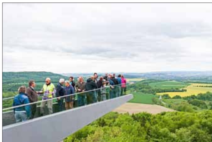
Der Skywalk am Sonnenstein konnte mit Hilfe der LEADER-Fördermittel 2017 fertig gestellt werden und lockt seit dem zahlreiche Touristen in die Region.

Die Aussichtsplattform „Skywalk“ auf dem Sonnenstein, die sich zum echten Besuchermagneten entwickelte, wurde ebenfalls mit Hilfe des Förderprogramms umgesetzt. Zu den geförderten Maßnahmen gehört auch die Dachsanierung des Naturschutzzentrums in Reifenstein, eine Einrichtung des NABU Regionalverbands Obereichsfeld. Damit kann der Verband seine Arbeit rund um die Themen Umweltbildung und den Naturschutz verbessern.