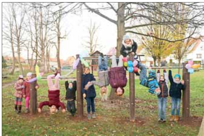
Das erste neue Spielgerät kam bei den „Testern“ auf jeden Fall sehr gut an!

IBAN: DE5182 0570 7002 2000 2851 - BIC: HELADEF1EIC, Verwendungszweck „Spielplatz Teichgarten“.