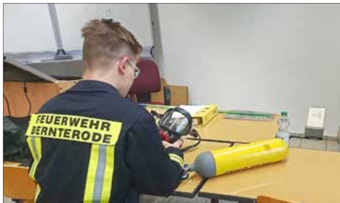
Im Feuerwehrzentrum wurden die 16 Lehrgangsteilnehmer in den Umgang mit Atemschutzgeräten eingewiesen

Der Einsatz unter Atemschutz stellt einen der anspruchsvollsten Einsatzbereiche in der Feuerwehr da. Um als Atemschutzgeräteträger eingesetzt werden zu können, müssen Feuerwehrleute daher besonderen Anforderungen gerecht werden. So müssen Sie unter anderem eine Gesundheitsuntersuchung durchlaufen, regelmäßig aus Aus- und Fortbildungen teilnehmen und einen Atemschutzgeräteträgerlehrgang absolvieren.