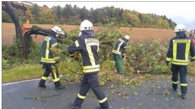
Einsatzkräfte beseitigen einen umgestürzten Baum auf der Straße zwischen Bernterode und Heiligenstadt

Auf Grund der orkanartigen Böen war auf ein Baum auf die Fahrbahn gestürzt.