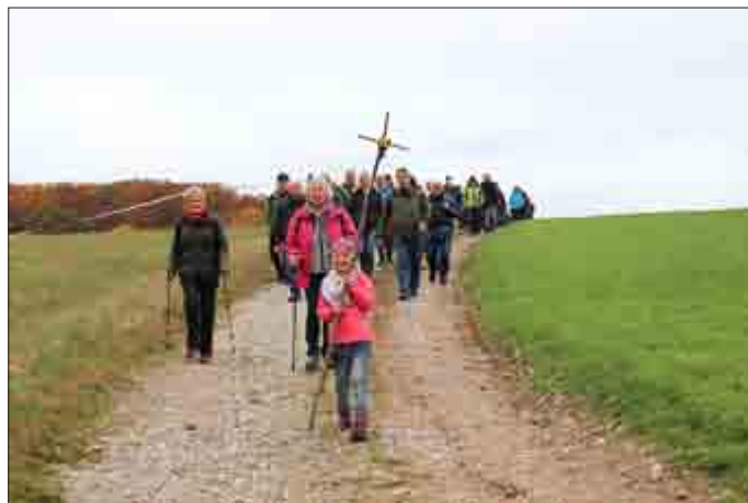
Ökumenischer Pilgertag 31.10.2016