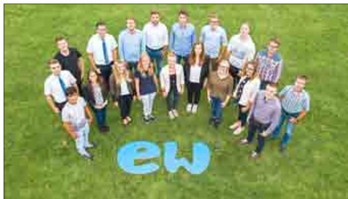
Netzwerk mit Zukunft: gefördert und gefordert werden aktuell 25 junge Menschen in den unterschiedlichsten praxisnahen Ausbildungswegen bei den Eichsfeldwerken.

Als einer der größten Arbeitgeber der Region bieten die EW ihren Nachwuchskräften anspruchsvolle Ausbildungsmöglichkeiten. Bereits jetzt laufen die Vorbereitungen für die Rekrutierung der nächsten Azubis. Zum 20. Oktober - pünktlich zum Berufsorientierungstag des Landkreises Eichsfeld - werden die neuen Ausbildungsstellen veröffentlicht. Alle Interessierten können sich an diesem Tag in der Leinefelder Obereichsfeldhalle auch gleich persönlich bei den Mitarbeitern der Eichsfeldwerke informieren.