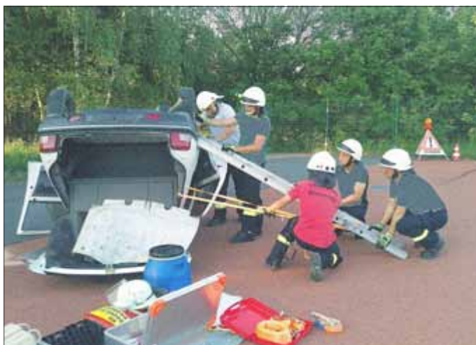
Einsatzkräfte stabilisieren Fahrzeug in Dachlage