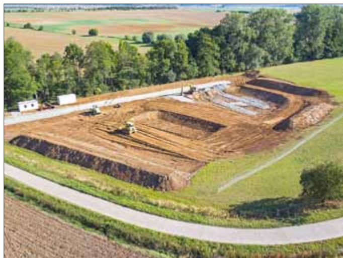
Mit dem Neubau der Kläranlage Schildbach entsteht eine zentrale, vollbiologische Kläranlage für 2.400 Einwohnerwerte.

verbands auch in Zukunft verlassen. In der Verbandsversammlung am 15. Dezember 2016 beschlossen dies die Bürgermeister mit der Trinkwasserpreiskalkulation für die Jahre 2017 und 2018. Seit mehr als 15 Jahren konnten damit die Trinkwasserentgelte bereits gesenkt oder konstant fortgeschrieben werden. Kontinuität gilt auch für den Abwasserbereich: Stabile Gebühren wurden 2013 für den Kalkulationszeitraum von vier Jahren bis einschließlich 2017 beschlossen. Trotz der hohen Investitionstätigkeit in die Infrastruktur ist der WAZ Obereichsfeld seit vielen Jahren der günstigste Ver- und Entsorger in Thüringen - Mitte des Jahres 2016 wurde dies erneut durch eine Erhebung des Bundes der Steuerzahler bestätigt.