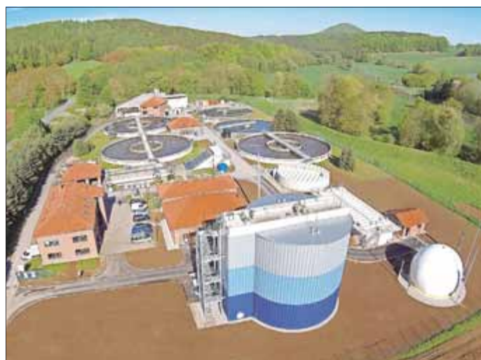
Abwasserentsorgung heute: Luftaufnahme der Kläranlage Leinetal bei Uder