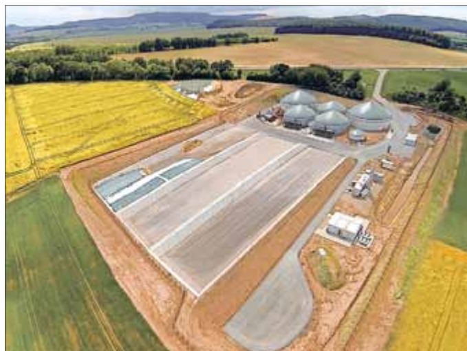
Die Biogasanlage Weißenborn-Lüderode ist seit 2013 in Betrieb.