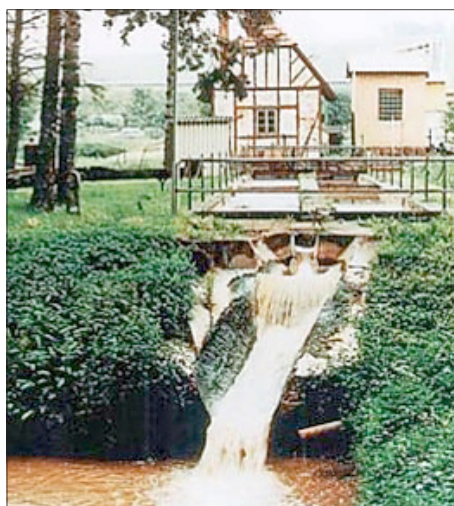
So sah das Betriebsgebäude der alten Kläranlage Heiligenstadt vor 1992 aus.