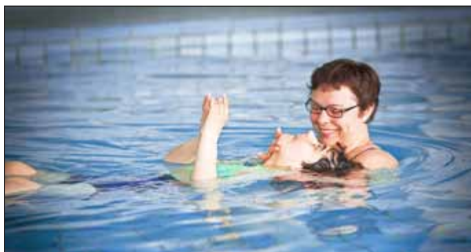
Meist sitzend im Rollstuhl, jetzt „schwebt“ sie entspannt im warmen Wasser.

Wie lernen Schüler heute an einer Förderschule? Eine Antwort darauf gab die St. Franziskus – Schule in Dingelstädt am 13.11.2015 inzwischen zum dritten Mal. Und die Schülerbibliothek war schließlich voll besetzt mit interessierten Gästen, darunter Eltern, Erzieherinnen und auch Lehrkräfte aus dem benachbarten Gymnasium. Jeder Teilnehmer konnte zwei Unterrichtsangebote auswählen. Um 9.00 Uhr begann die erste Einheit mit insgesamt 6 Lernangeboten aus verschiedenen Klassenstufen: ein Morgenkreis der 1. Klasse und Wochenplanarbeit (beide Unterstufe), ein klassenübergreifender Kurs Lesen/Schreiben, sowie Bewegung und Entspannung oder Lernen am Computer (alles Mittelstufe) bis hin zum Werkunterricht (Werkstufe).