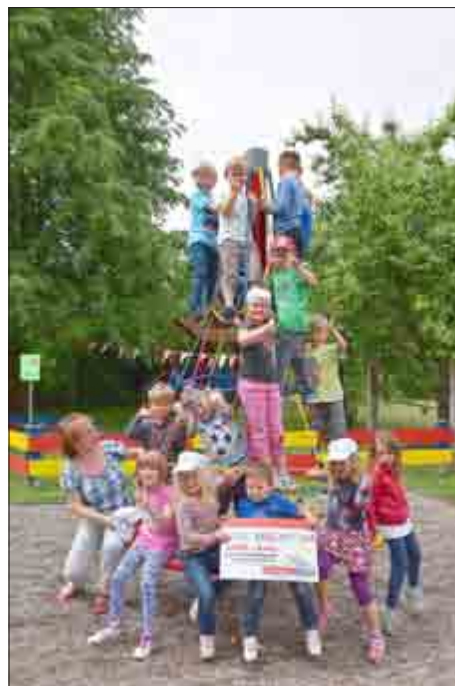
Unser neues Spielgerät - eine Kletterpyramide

Die Mitarbeiter vom kath. Kindergarten „St. Ursula“ - „St. Martin“ in Geismar und Kella