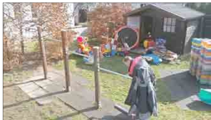
Bilder vom Frühjahrsputz — viele fleißige Hände