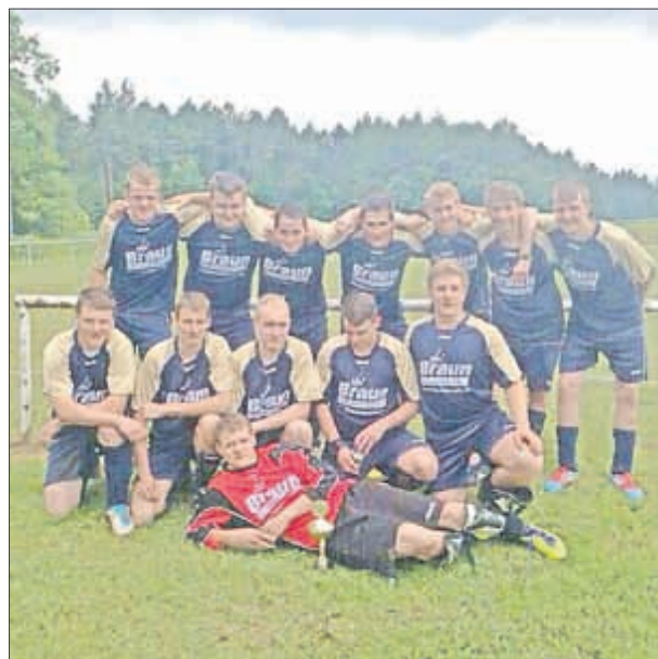
Die Freizeitmannschaft von Empor Kella

Wir freuen uns auf Euer Kommen und wünschen allen ein schönes Sportfest!