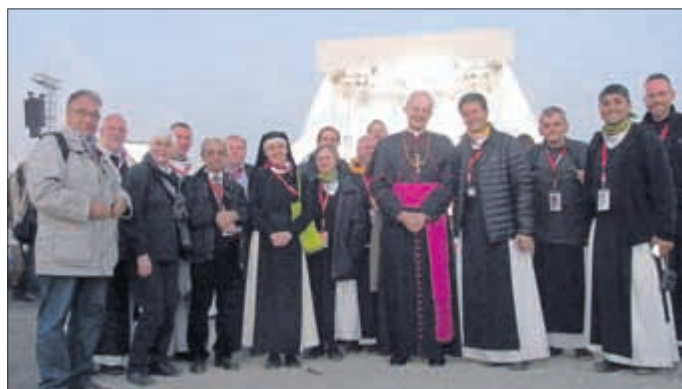
Begegnung des Bundesvorstandes des Bundes der Eichsfelder Vereine und des Zisterzienserkonventes Bochum-Stiepel mit Bischof Dr. Franz-Josef Overbeck (Essen, Mitte) im Rahmen des Besuchs Papst Benedikt XVI. am 23. September 2011 in Eitzelsbach.

(Eine Anmeldung ist auch direkt über den Internet-Link http://www.thon-reisen.de/unsere-reisen/wallfahrten-2014/eichsfeld-treffen-in-stiepel.html möglich!)