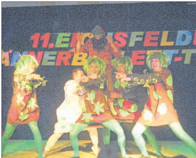
der Wettbewerbszweite Uder ist Ausrichter 2015