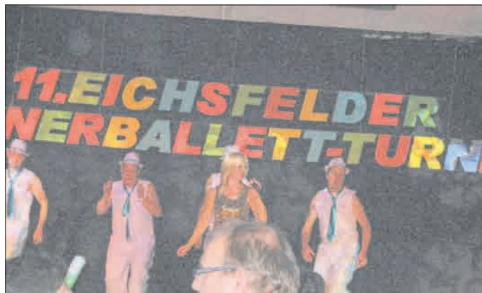
der Titelverteidiger Pfaffschwende mit Trainerin als Helene Fischer-Double