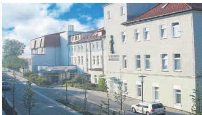
Das Haus St. Elisabeth des Eichsfeld Klinikums in Worbis.