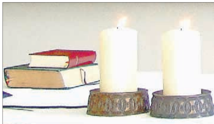
Kerzen und Bücher auf einem Altar erinnern an das gemeinsame Verweilen vor Gott.