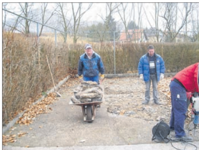
Im Freibad wurde Beton gestemmt und weggekartt, hier soll eine Überdachung entstehen