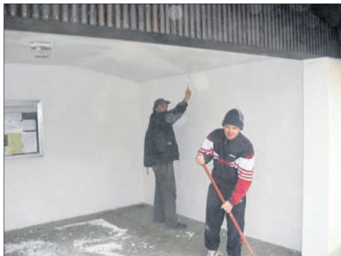
Im letzten Jahr wurde das Wartehäuschen außen gestrichen in diesem Jahr war innen dran