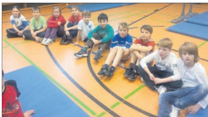
Interessierte für die Sportförderklasse

Eine aktive Betätigung nach dem Unterricht ist auch in der Schulbibliothek, bei der Homepage-Crew sowie den „Wetterfröschen“ (eigene Messstation Heiligenstadt, Richtenberg) möglich.