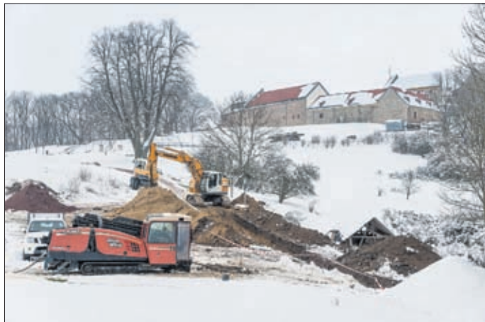
Verlegung der Erdgas- und Abwasserleitung von der Burg Scharfenstein nach Beuren