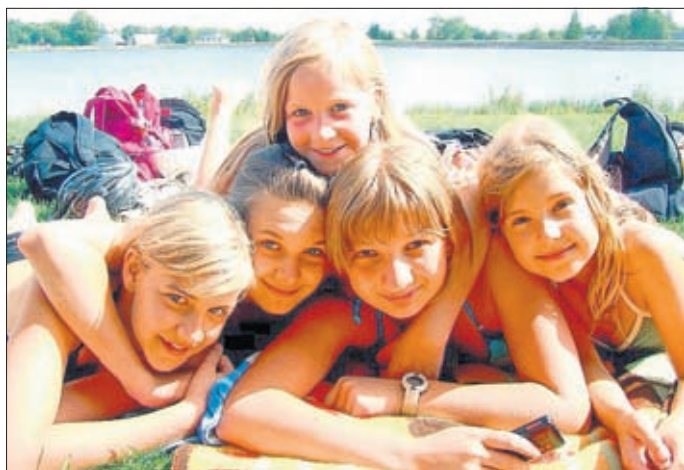
Dicke Freundschaften bei Ferienspaß - unvergesslich.

Informationen gibt es im Internet: www.gruene-schule-grenzenlos.de oder einfach anrufen unter 03732080170.