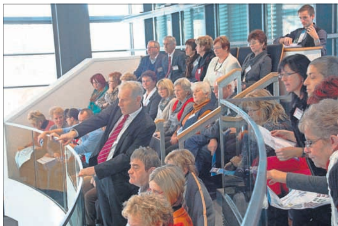
Auf der Besuchertribüne des Thüringer Landtags

Arbeitskreis UnternehmerFrauen im Handwerk