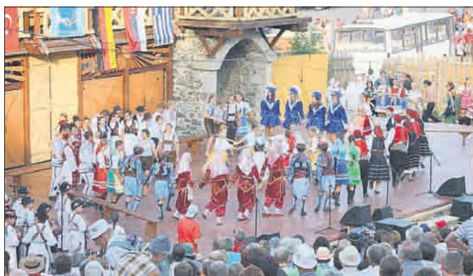
Gemeinsamer Abschluss - So bunt ist Europa