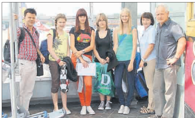
Die deutschen Teilnehmer am Flughafen