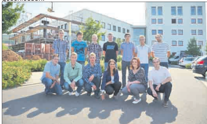
Investition in die Zukunft: Seit fast 20 Jahren kümmern sich die Eichsfeldwerke selbst um qualifizierte Nachwuchskräfte.

Insgesamt 20 junge Frauen und Männer absolvieren derzeit bei den Eichsfeldwerken in zehn Berufen ihre Ausbildung. Bereits seit 1993 sorgt die Unternehmensgruppe als Ausbildungsbetrieb selbst für qualifizierten Nachwuchs. 50 junge Menschen haben bis heute ihre praxisorientierte Berufsausbildung erfolgreich abgeschlossen.