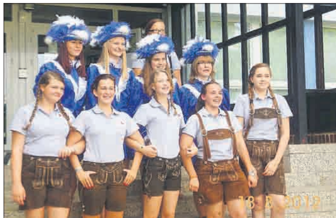
Vertreter von Deutschland und Österreich