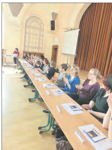
Ehemalige stellen sich den Schülern vor

(Verantwortlich für Berufs- und Studienorientierung)