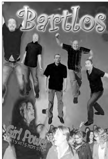
Party, Rock, Tanz, Show - BARTLOS

Bartlos ist eine junge dynamische Party-, Tanz- und Showband aus Thüringen. Jeder einzelne versteht sein Handwerk auf's Beste. BARTLOS ging ursprünglich 1997 als reine Oldietanzband an den Start. Der Name BARTLOS steht musikstilbezeichnend als Synonym für niemals alt werdende und immergrüne Rockklassiker, nicht etwa für entfernte Gesichtsbearbeitung. Inzwischen werden neben den Rockoldies vergangener Zeiten dem immer jünger werdenden Publikum auch aktuelle Titel zeitgenössischer Künstler dargeboten,