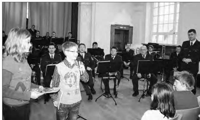
Dank der Schüler

Um 10:35 Uhr versammelten sich alle Schüler der 5. und 6. Klassen unserer Schule und die 4. Klassen der Grundschule „Erich Kästner“ in der Aula. Das Orchester begrüßte uns mit der Europahymne.